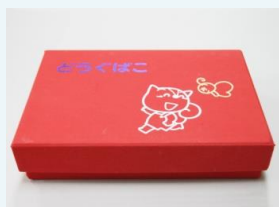
お道具箱の中の物

クレヨン・ロケッタン・色鉛筆は、フタ、ケース、1本1本に名前を記載してください。 (お道具箱は、園で名前を記載します)