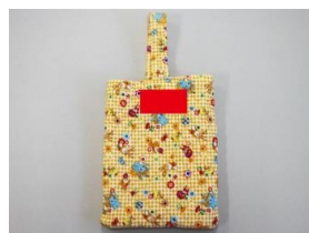
外ズック・ぞうり入